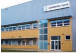
ハリマテックチェコ,s.r.o.