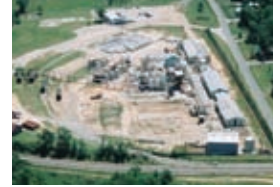
ブラズミン・テクノロジー,INC. ブラズミン・テクノロジー ベイミネット工場