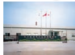
杭州哈利瑪電材技術有限公司