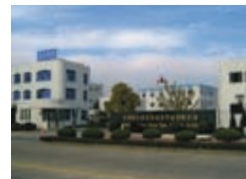
杭州杭化播磨造紙化学品 有限公司