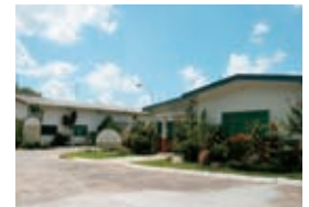
ハリマ・ド・ブラジル・インダストリア・ キミカLTDA. 本社工場