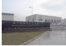
南寧哈利瑪化工有限公司