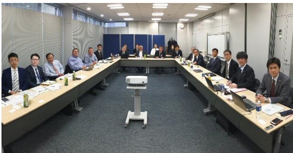
グローバルなコミュニケーションも充実

今後もハリマ化成グループでは、労働環境の改善を実施し、更なる働き方改革に努めてまいります。