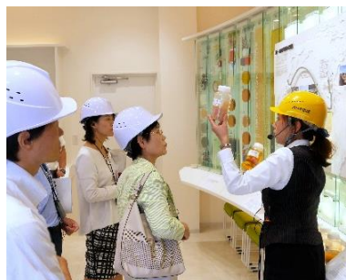
創意工夫を活かした視察対応